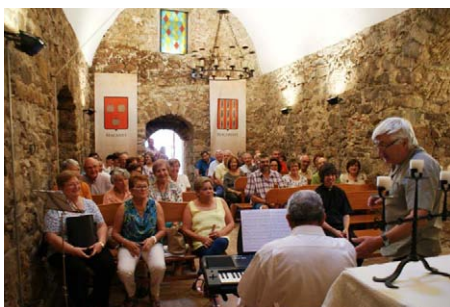
Setembre. Valldemaria. Festa de les Mare de Deus trobades