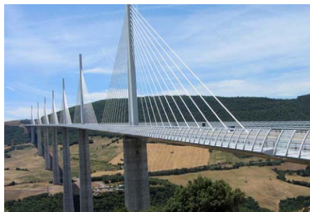
Juliol. Pont de Millau. Vàrem visitar Besiers i el pont de Millau