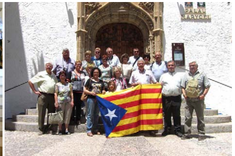
Maig. Sitges. Visita Cau Ferrat i el museu Mar i Cel