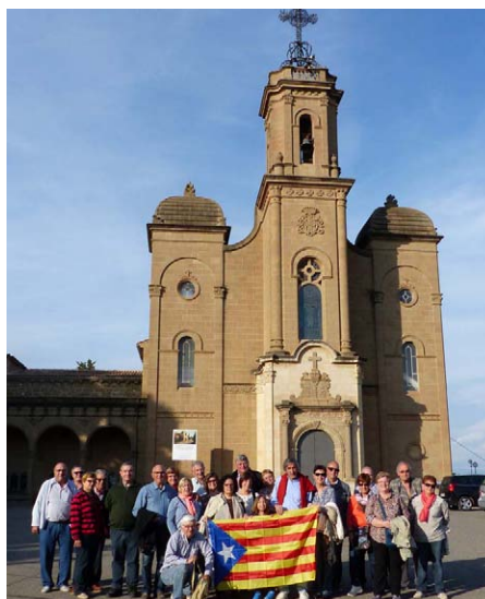
Octubre. Col·legiata d'Àger i Balaguer. La col·legiata, un edifici amb molta història