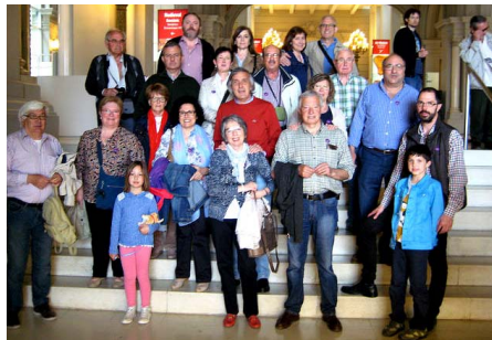
Abril. MNAC. Visita al museu nacional d'art de Catalunya i el Fossar de les Moreres