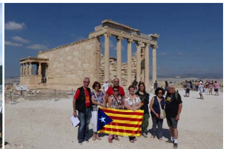
Setembre. Grècia. El bressol de la nostra civilització