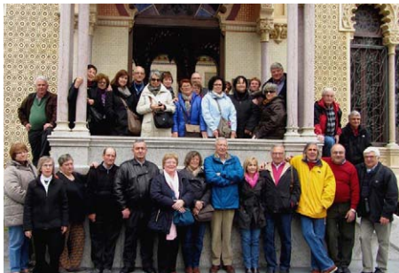
Març. L'Arboç. Vàrem visitar la Giralda i el llac de Castellet