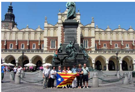
Juny. Cràcovia. Visita la ciutat i els seus monuments