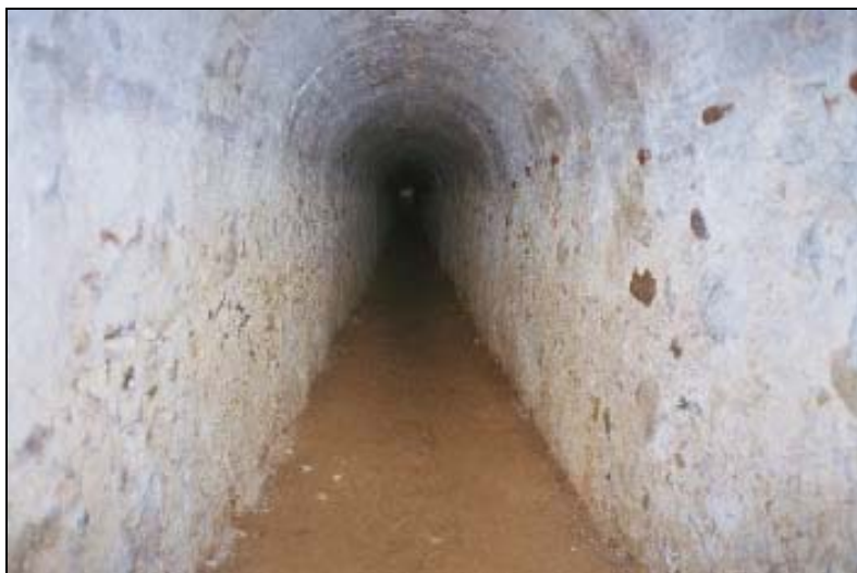
Entrada a les galeries de contramina

Les obres defensives conservades intactes i en la seva totalitat són: un gran hornabeque principal i dos de més petits, dues contraguàrdies, set revellines de diferents tamanys i cinc galeries de contramina.