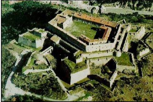
Vista aèria de Bellegarde

El Castell de Sant Ferran fou construït a fi de defensar l'Empordà dels francesos. Davant seu tenia el fort francès de Bellegarde situat a sobre el Portús (le Porthus).